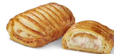
Cesta jamón y queso