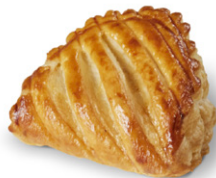
Media luna manzana vainilla