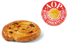
Mini caracola pasas